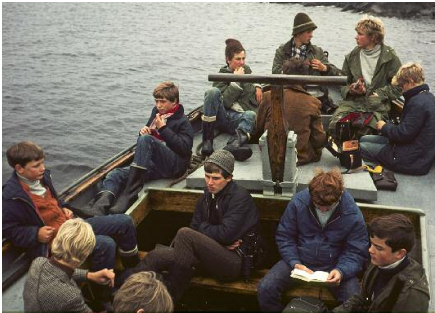
Ett gäng i spänd förväntan på att komma fram till Enskär.

I hyrd fiskebåt från Oxelösund åkte 14 fältbiologer till Enskär. Från den resan och från några senare tillfällen under kommande höstar visas här bilder som togs då.