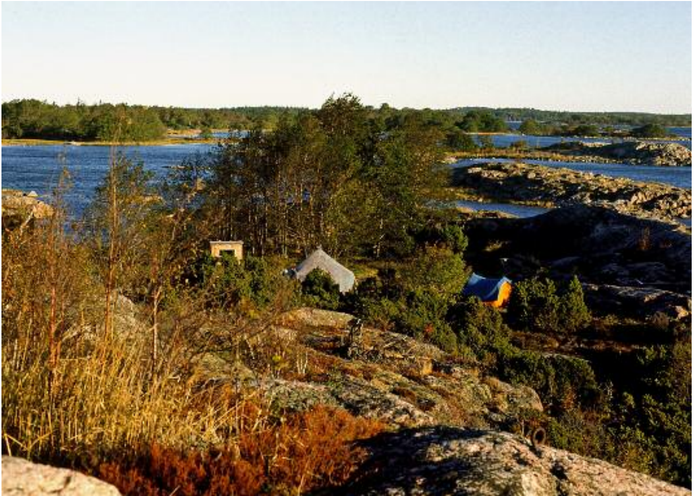
En vy över lägret, man bodde då i tält.