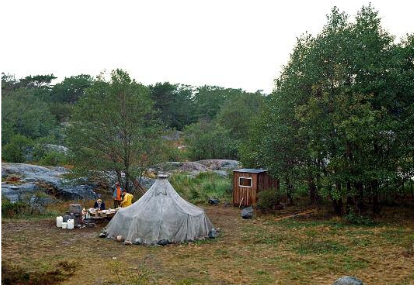
Bostaden, det gamla militärtältet, och ringmärkarkuren till höger.