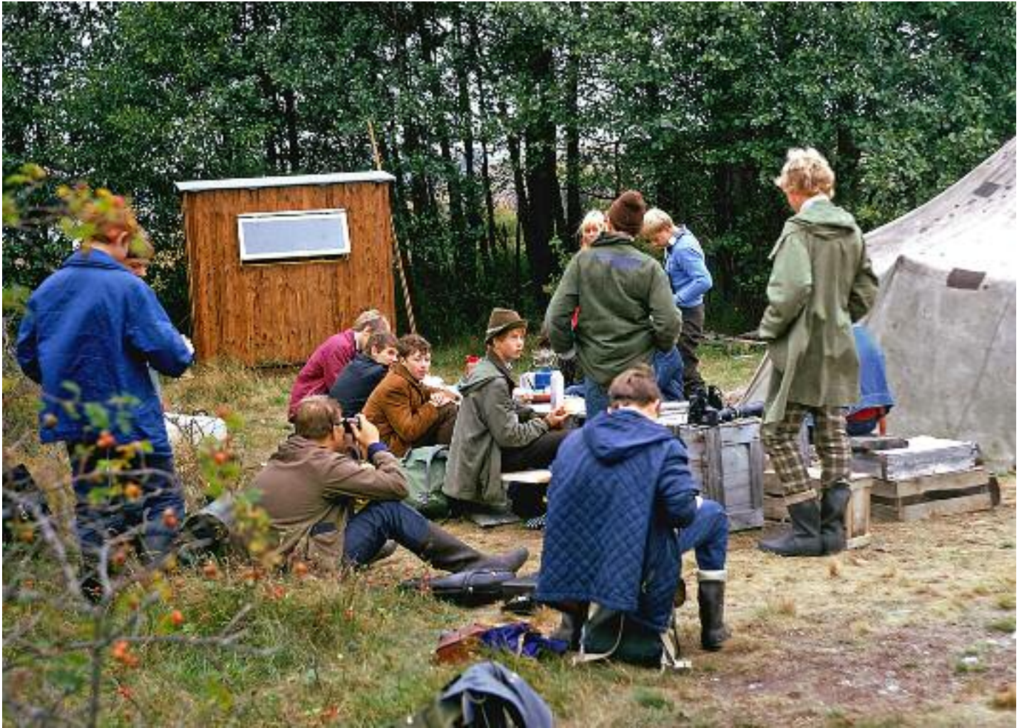
Samling vid matbordet.