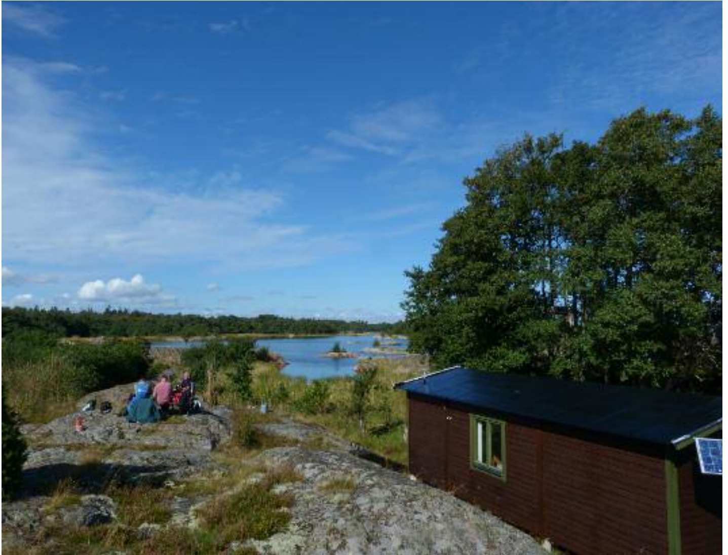
Fikar gör man fortfarande på Enskär, i strålande solsken sitter man med bra utsikt över området.