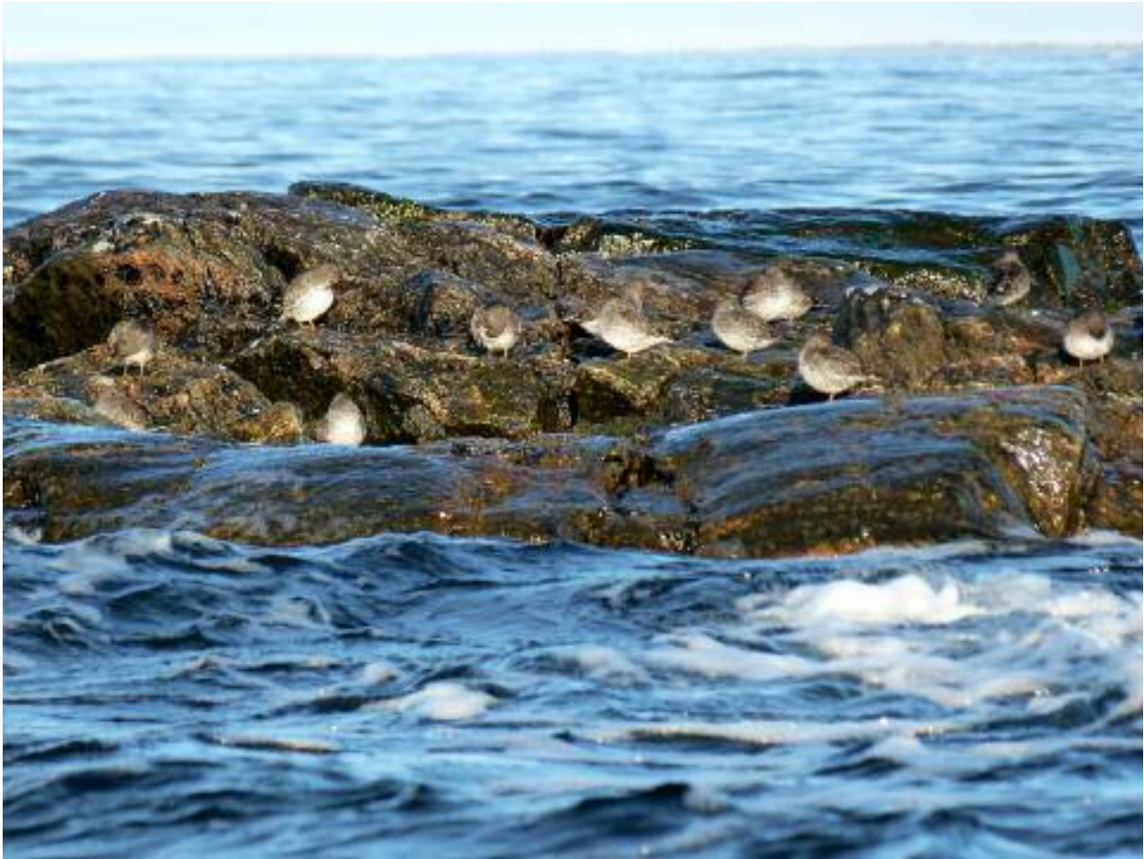
Skärnäppor på ett skär.