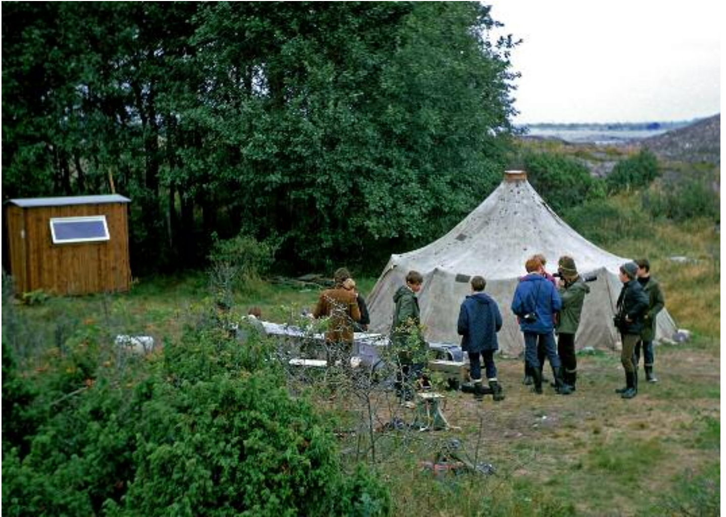
Samling vid lägret.