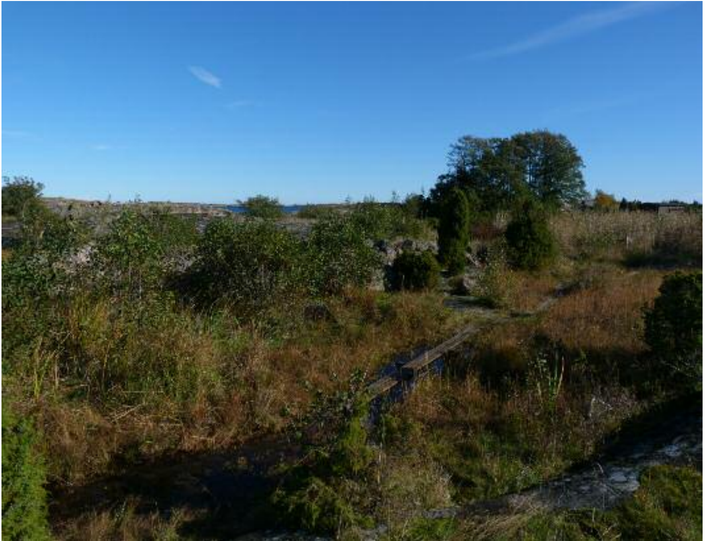
På blöta spänger tar man sig fram till de olika fångstplatserna.